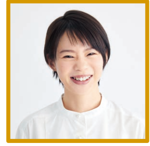
高木菜那 スピードスケート