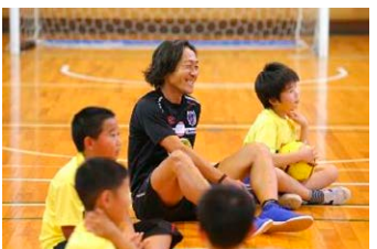
石川 直宏氏 (元サッカー選手・日本代表)