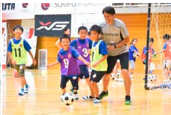
檜崎 正剛氏 (元サッカー選手・日本代表)