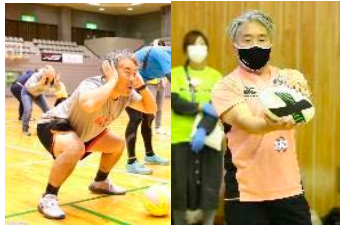
向井 陽氏 (元ラグビー選手)

JTLプレイリーダーの資格を持ったアスリートや教育現場従事者が参加。複数種目のトップアスリートが自身の経験、各競技の知識に加え、子供への触れ合いのコツ、子供の現状、子供を楽しませるノウハウなどを保持。各会場に2名が参加し、子供たちを運動・あそびにのめり込ませます。