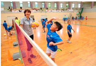
宝来 麻紀子氏 (元バレー選手・日本代表)

当機構に加盟する9競技12リーグに所属、又所属していた、各リーグ・日本代表で活躍したアスリートが講師として参加。各会場に各競技2名ずつが参加し、各競技の魅力を伝えます。