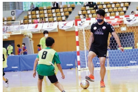
塚原 直貴氏 (元陸上短距離選手・日本代表)