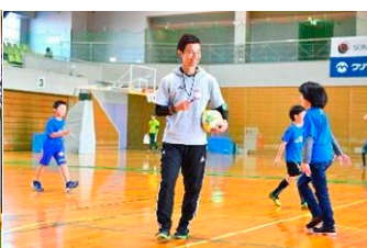
相根 澄氏 (元フットサル選手・日本代表)