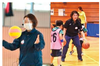
三木 聖美氏 (元バスケ選手・日本代表)