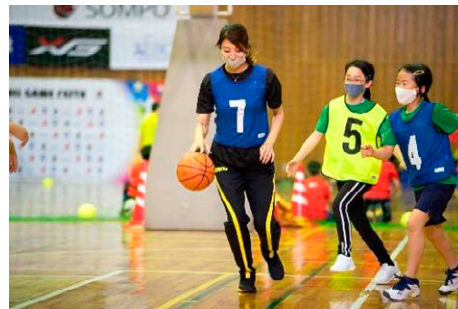
青木 愛氏 (元アーティスティックスイミング選手・日本代表)