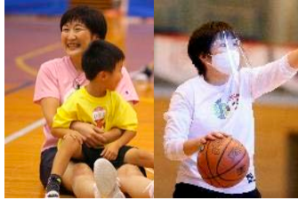
岩屋 睦子氏 (元バスケ選手・日本代表)