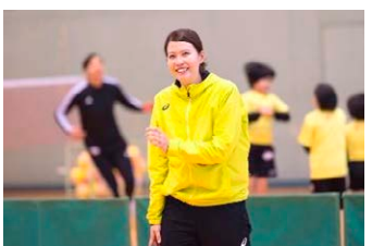
藤間 かおり氏 (元ハンド選手・日本代表)