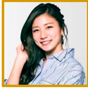
青木愛 アーティスティックスイミング