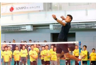
諸隈 直樹氏 (元バレー選手・日本代表)