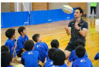
川合 レオ氏 (元ラグビー選手・日本代表)