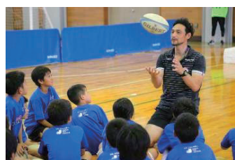
川合 レオ氏 (元ラグビー選手・日本代表)