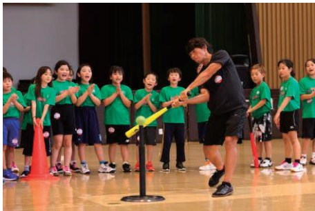
佐藤 寿人氏 (元サッカー選手・日本代表)