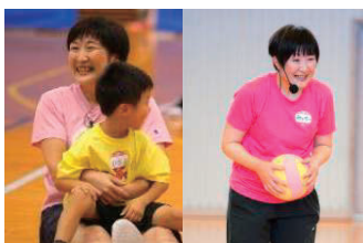
岩屋 睦子氏 (元バスケ選手・日本代表)