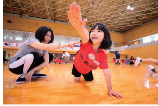
AMの「あそびバ！」がスタート。親子で“運動・あそび”を行います。