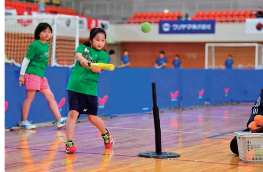
AMと同様に開講式を行い、「キッズチャレンジ」スタート。4種目をローテーションで体験します。アンバサダーやスペシャルゲストは、各班の子供たちと一緒に体験します。