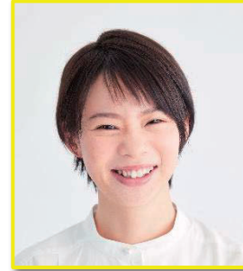
高木 菜那 スピードスケート