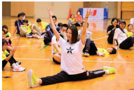
青木 愛氏 (元アーティスティックスイミング選手・日本代表)