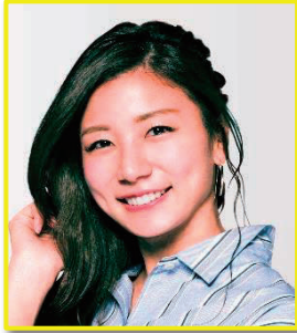
青木 愛 アーティスティックスイミング