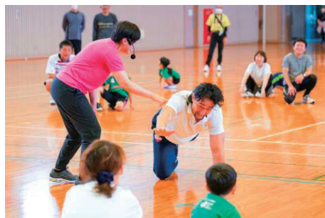
大野 均氏 (元ラグビー選手・日本代表)