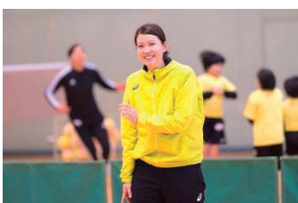
藤間 かおり氏 (元ハンド選手・日本代表)