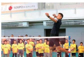
諸隈 直樹氏 (元バレー選手・日本代表)

当機構に加盟する9競技12リーグに所属、又所属していた、各リーグ・日本代表で活躍したアスリートが講師として参加。各会場に各競技2名ずつが参加し、各競技の魅力を伝えます。