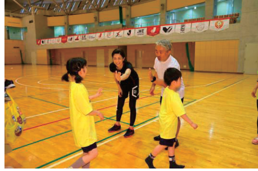
「あそびバ！」プログラム終了 一人一人に修了証を授与します。