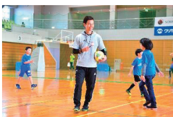
相根 澄氏 (元フットサル選手・日本代表)