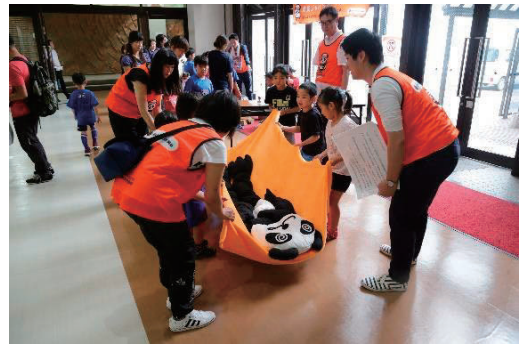
トップスポンサーのSOMPOホールディングスによる防災意識を高めるワークショップや、地域スポンサーとして地元企業などが参加し、ブース出展や写真撮影会も。