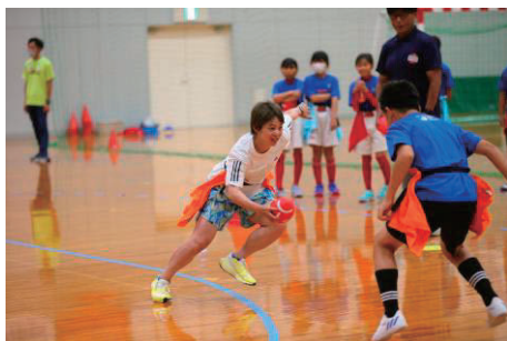
高木 菜那氏 (元スピードスケート選手・日本代表)