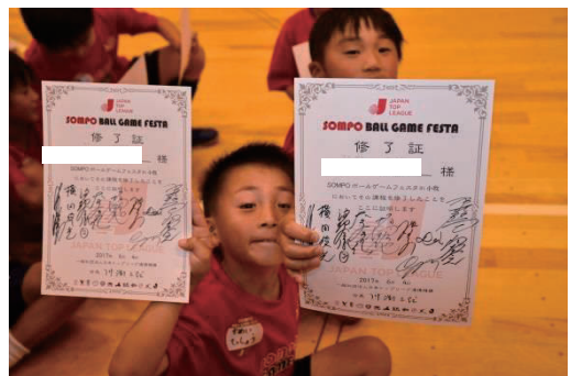
「キッズチャレンジ」プログラム終了 一人一人に修了証を授与します。