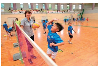
宝来 麻紀子氏 (元バレー選手・日本代表)