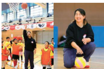
三木 聖美氏 (元バスケ選手・日本代表)